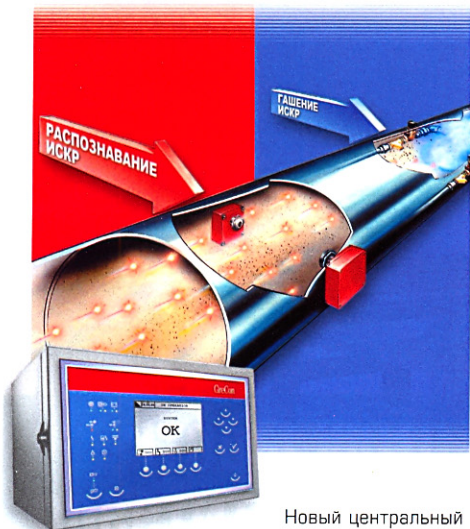
Новый центральный пульт установки искрогашения

Благодаря модульному принципу обеспечивается оптимальная конфигурация применительно к любым производствам, будь то малое мебельное предприятие с односекционным фильтром или циклоном, или большой завод