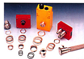
Искросигнальные датчики серии BS7