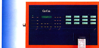
Пульт серии BS7