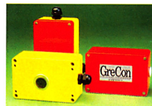
Искросигнальные датчики серии BS6